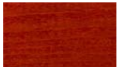
LV 23, mahonki