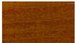
LV 22, pähkinä