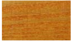
LV 506, punapyökki