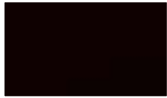
LV 1596, wenge